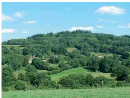
Paysage du sentier 'les Hauts de Bujaleuf'