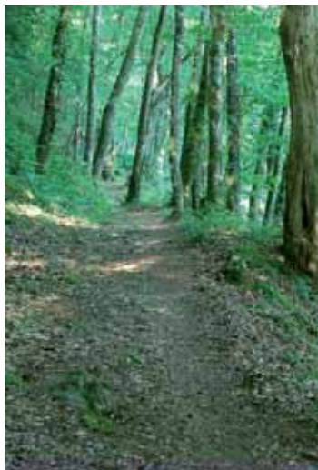
Un chemin dans le massif forestier de Bujaleuf sentier 'le Belvédère'