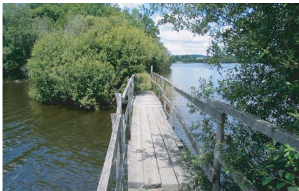
Les passerelles du lac de Saint-Pardoux