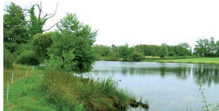
l'étang de Charrain

7 A la sortie du village de la Coussedière, emprunter sur quelques mètres à gauche la voie communale et admirer à droite sur le talus une ravissante fontaine en pierres sèches. Tout de suite après, prendre à droite le chemin. En contrebas apparaît la pittoresque rivière 'la Bazine'. Continuer sur le chemin quelques mètres.