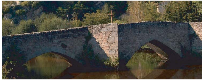
Pont de la Pierre à Bellac