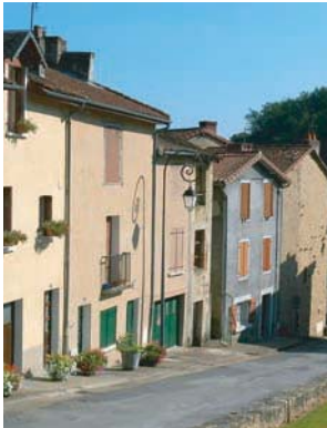
Quartier de Bellac au bord du Vincou

Il date du XIII ème siècle. Solidaire du développement de l'ancien château, le Pont de la Pierre dessert le quartier de Chapterie. Les marchands l'empruntaient pour rejoindre en ligne droite la seigneurie de Mortemart. Par cet axe commercial médiéval étaient acheminés, depuis le littoral de Saintonge, le sel, les poissons de mer et les vins de Charente.