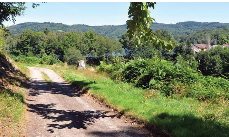
village de Massugéras

Plus tard encore, vers 1080, la région de Muret a accueilli l'ermite Etienne, puis ses disciples qui seront à l'origine de l'ordre de Grandmont. L'étang de Jonas, la grange dimière du Coudier sont des témoignages remarquables de l'activité des moines à cette époque. (Source Commune)