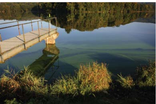
ponton de pêche à Jonas