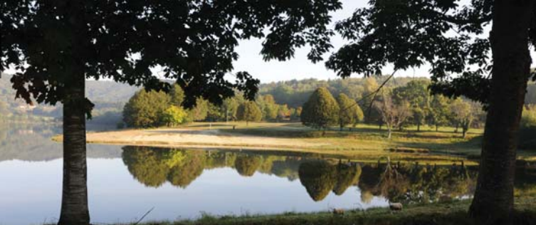
étang de Jonas