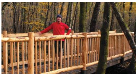
Passerelle sur l'Auzette

La commune de Panazol abrite conjointement avec la commune voisine de Saint-Just-le-Martel la ZNIEFF « Ruisseau de l'Auzette en amont de l'étang de Cordelas », d'une surface totale de 73 hectares. Cette réglementation est appliquée en particulier en raison des caches pour la faune constituées par les sous-berges fragiles et la végétation aquatique rivulaire, notamment pour d'importantes populations d'écrevisses à pattes blanches. (Source Wikipédia)