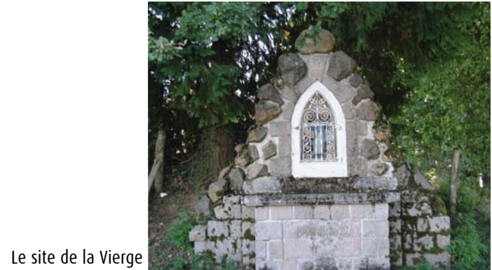
Le site de la Vierge

De son passé plus récent, la ville conserve « le château » où le célèbre Guillaume Dupuytren passa son enfance au lieu-dit « Chez-le-Rat ».