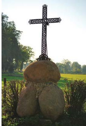
La croix du Mèchant

8 Arrivé à la RD11A, la prendre à gauche et la suivre jusqu'au bourg de Condat-sur-Vienne. Rejoindre le point de départ.