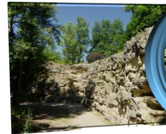
Falaise de La Lirette