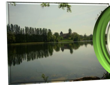
Lacs de Laubesc